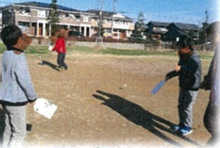
中央公園で羽子板