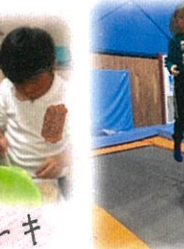
大きな トランポリン バランスを とりながら 跳びたわ。