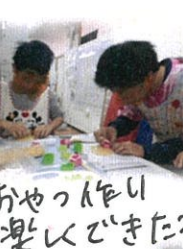
おやつ作り 楽しくできたわ!