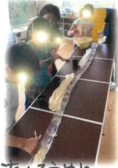
手打ちきしめん 流しそうめん