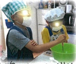
炭酸ジュワジュワゼリー